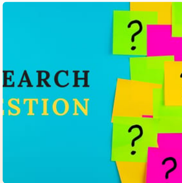
Question de recherche

Il est crucial de préciser la question de recherche et de choisir les mots clés correspondants pour collecter des documents pertinents.